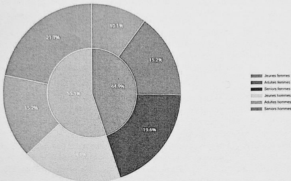
Légende : Proportion homme (vert) / femme(rouge) en fonction des catégories d'âge

Depuis 2016, le nombre d'adhérent jeune diminue légèrement, contraint par la place limitée dans les entraînements. Le club peut se féliciter d'avoir 45% de femme dans ce sport mixte (contre 37% en 2022). Le club a également une tendance à se rajeunir avec une proportion de vétéran (35 ans et +) qui diminue par rapport au sénior.